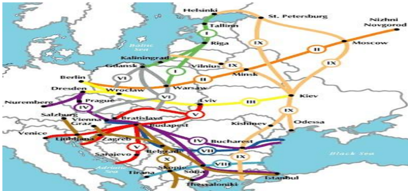
(Πανευρωπαϊκοί Διάδρομοι )

Η συνολική αξία των έργων υποδομής στη Σερβία που υλοποιούνται ή βρίσκονται σε φάση προετοιμασίας είναι 14,5 δισ. Ευρώ. Οι επενδύσεις στον τομέα αυτό θα αποτελέσουν σημαντική κινητήρια δύναμη για την